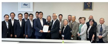
公明党UR住宅等の居住の安定等推進委員会