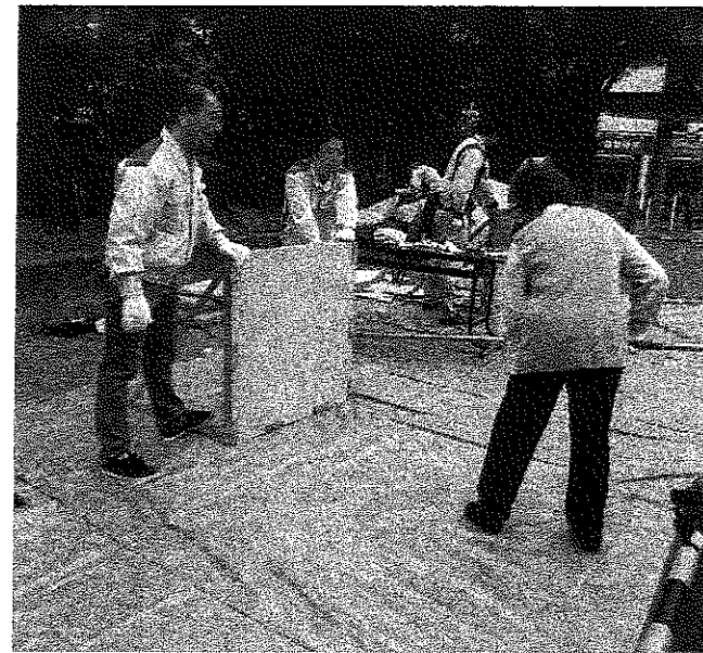
昨年の防災訓練より隔て板わり体験

王子五丁目団地自治会は11月1日(日)、防災学習会を開きます。居住者のみなさんが、ぜひともご参加くださいますようお願いいたします。 東京都と各区は、東日本大震災によって「首都直下の巨大地震」の時期が早まってきているとして、災害対策を強化しています。震度7の地域が出るとともに、震度6強以上の地域が7割に及ぶと想定されます。