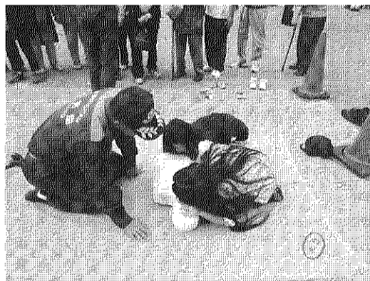
子供たちも真剣に救命措置にチャレンジ

東京直下型地震など大災害が発生したとき、あなたの家だけで対処することはできません。いざという時、家庭での対策をつくるのが急務になってきます。また、団地全体、みんなが助けあ