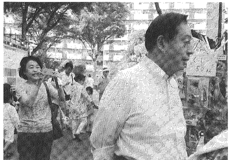
【左上】エイ！割れたかな？子供もスイカ割り大会。 【左下】テントに表敬訪問。右から曾根はじめ都議。池内さおり衆議院議員、左が宇都宮章区議。 【中上】北住まいセンター職員。管理サービス事務所のみなさん。 【中下】花川與惣太北区長。 【右】太田昭宏国土交通大臣は模擬店をまわっています。左が古田しのぶ区議。

自治会は居住者相互による「たすけあいの会」を2013年2月に開始しました。日常的な困り事を活動会員(ボランティア)が手助けをします。利用する方、ボランティア双方がこの会に入会し入会金1,000円を会に支払います。(一度入会金を支払えば会費は不要です)。 ◇利用料金はチケットを購入します。(4枚綴り1,000円) ◇引越などチケットを利用しなくなった場合チケットの枚数に応じて返金します。 ◇交通費が発生した場合 は実費をいただきます。 ◇留守番電話での受付は受け付けません。 ◇年末の大掃除や、専門的な依頼など、内容によってはお断りすることもあります。 ◇主な内容 ○洗濯 ○買い物 ○掃除 ○買い物の病院などの付き添い ○役所等の代行 ○衣類の衣替えの手伝い ○粗大ゴミの交換 ○家具の移動 ○電球の交換 ○その他日常で不便に感じていることは相談ください。 ◇連絡先 自治会事務所 (月)～(金)午前9時～午後4時 (土)午前9時～正午 ◇利用時間 午前9時～午後5時頃 ◎それ以上の利用時間を