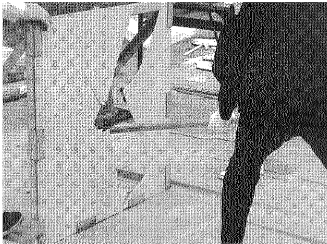
昨年の震災訓練で隔て板を物干し竿で割る訓練