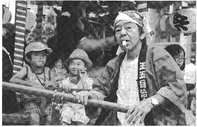
よ！会長、毎年頑張ってだしの棍棒を守っています。