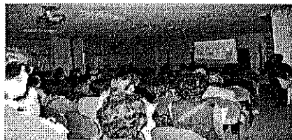
写真は昨年の防災学習会のビデオ上映