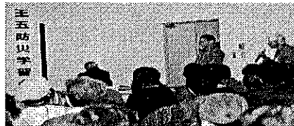
北区防災課の説明にみんな真剣な表情