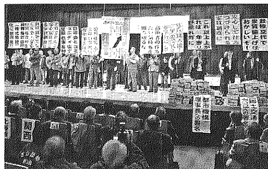
1月24日午後、衆議院第2議員会館で「公団住宅を公共住宅として守れ! 緊急国会要請集会(全国公団住宅自治会協議会主催)が開かれ、民主、自民、公明、共産各党の20人の国会議員と20人の代理が出席。都市機構賃貸住宅の特殊会社化に反対することを決議しました。

遊具に関する国の安全領域に関する基準の変更に伴い、団地内の遊具の改修工事が近々実施されます。