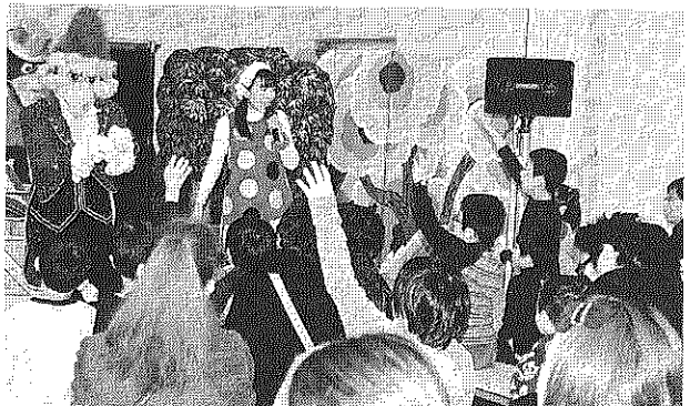
子どもも大人も盛り上がったクリスマス会