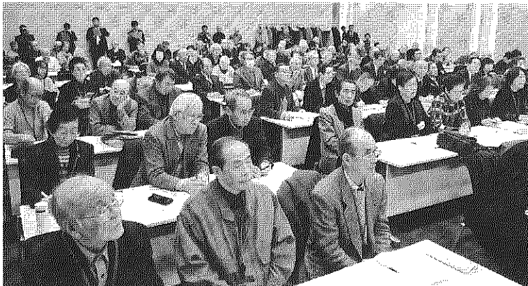
公団住宅の売却・削減、民営化に反対 公共住宅として守ろう一全国公団住宅居住者総決起集会(2011年12月7日、日本教育会館)。王五団地を含む全国の居住者の署名が壇上に。舞台は東京23区自治協の報告会場。王五自治会からも多数が参加しました。