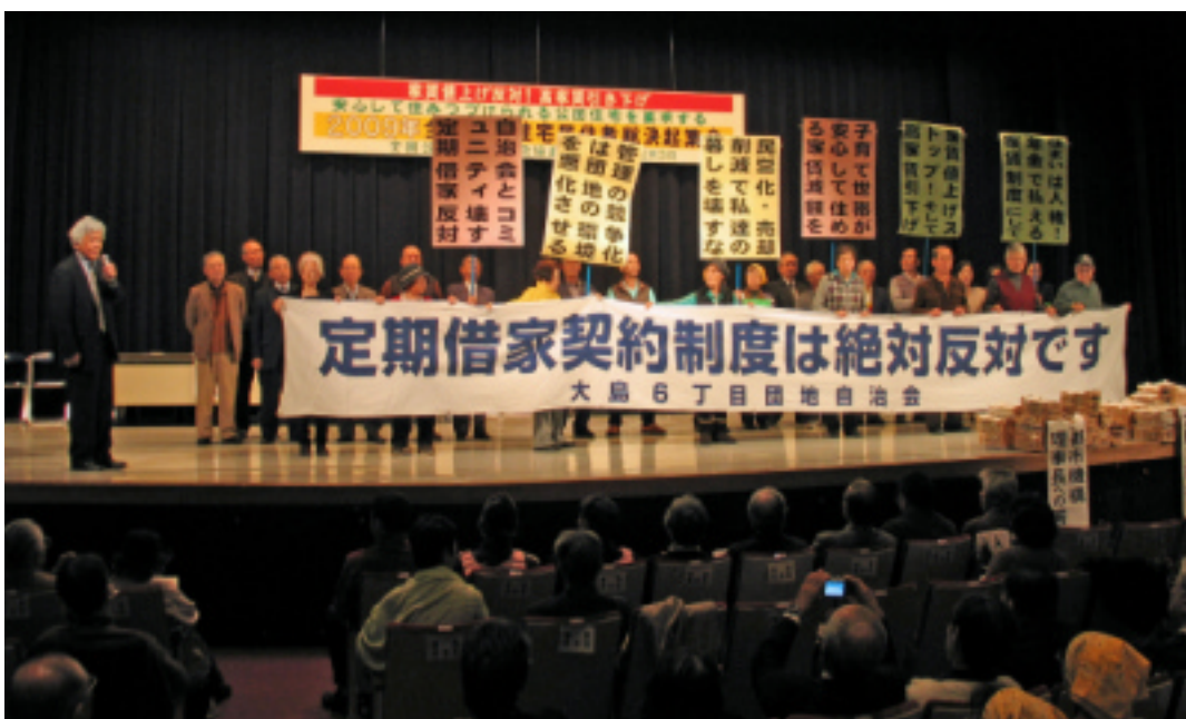
家賃値上げ反対を訴える東京23区自治協の各団地代表。王五自治会の参加者も壇上に