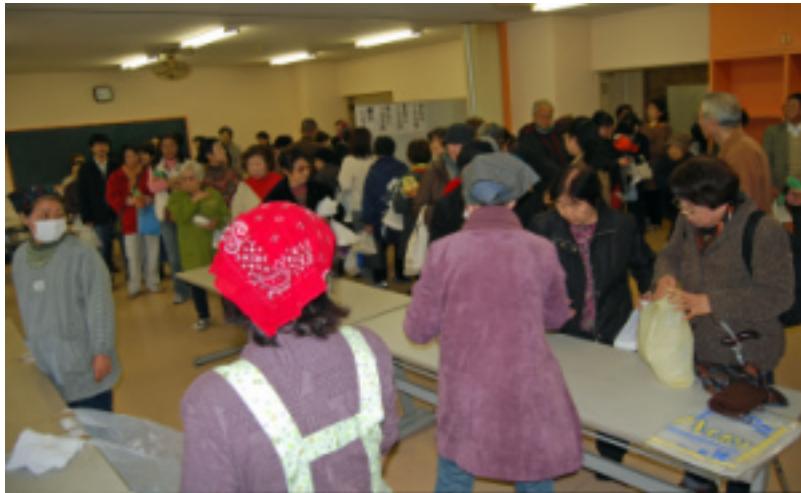
11時からの開始時間直後から大行列。お待たせしてすみません

団地自治会は毎年恒例の「フェスタ王五」を12月3日(日)、集会所で開催しました。東京北住宅管理センターの所長を始め職員の方々が応援に駆けつけてくださり、無事140kgのもち米をつき上げることができました。