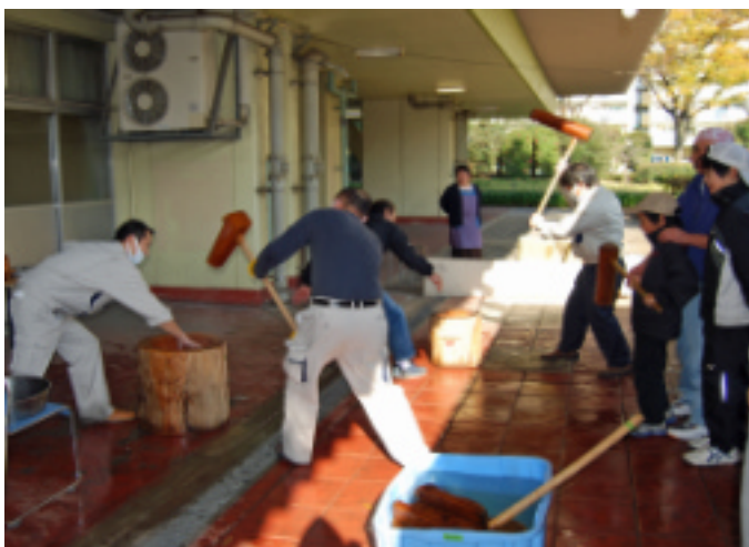
行列がプレッシャー、必死の住宅管理センター応援隊

参加会員世帯に白もちと砂糖を無料配布。毎回好評のあんこ・きなこもちなど豚汁を販売。また居住者力作の作品展などのコーナーでは、 リーマーケットが開かれました。午前11時の制限をすするなど、つ