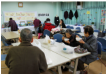
すてきな作品展と「食堂」

参加会員世帯に白もちと砂糖を無料配布。毎回好評のあんこ・きなこもちなど豚汁を販売。また居住者力作の作品展などのコーナーでは、 リーマーケットが開かれました。午前11時の制限をすするなど、つ