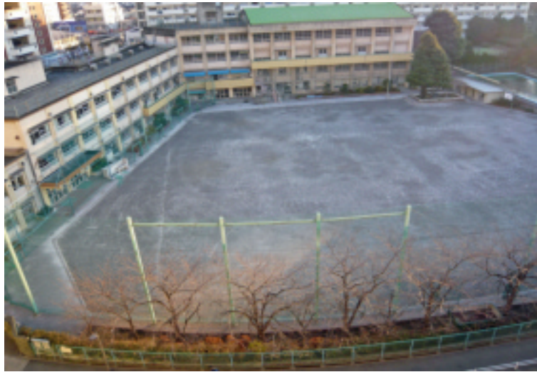
旧桜田中学校(現在、王子校中学校)跡地

北区政策経営部はこのほど王子町会自治会連合会に「旧桜田中学校敷地の土壌概況調査」を2010年1月下旬に開始すると説明しました。旧桜田小・中学校の跡地利用計画が2007年3月にまとめられて以来、具体的な動きがやっと始まりました。