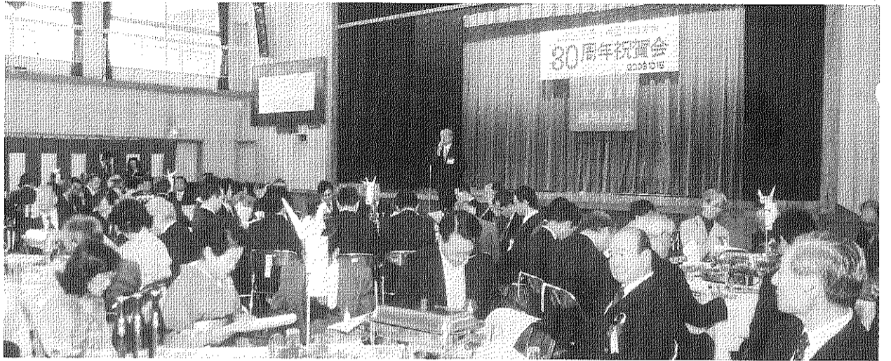
2000名の参加で盛大に、なごやかに(10月15日)