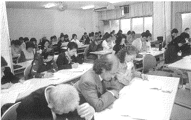
議案書に目を通す代議員・役員のみなさん

転車問題としてシールの外部流出や玄関ドア塗装について、エントランスホールでの引越業者の車両問題等意見が出されました。総会終了後すぐに機構へ要望を出し問題の解決にむけ話し合いが行われていまして、四月には住宅政策関連法に対する国会議員への要請行動、五月には衆院国土交通委員会での法案審議の傍聴に代表が参加しました。