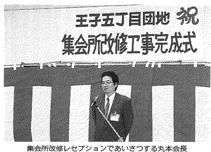
祝 王子五丁目団地 集会所改修工事完成式