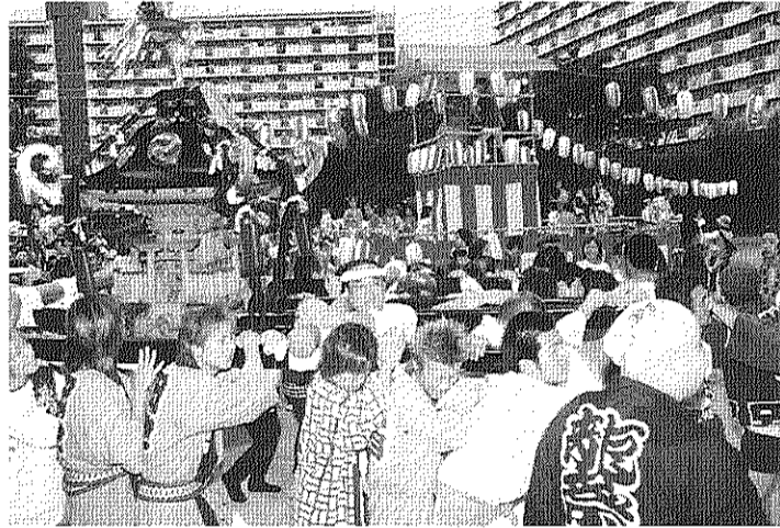
中央広場を巡行する大人みこし (昨年のまつりから)