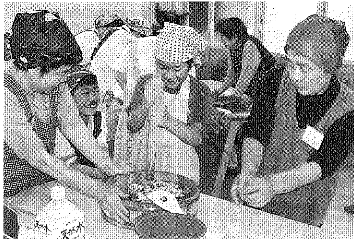
子供達と一緒によもぎもちを作りました