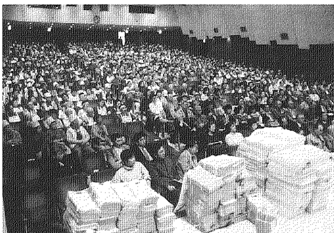
公団民営化反対の大集会には署名の山が (10月26日・日本教育会館)