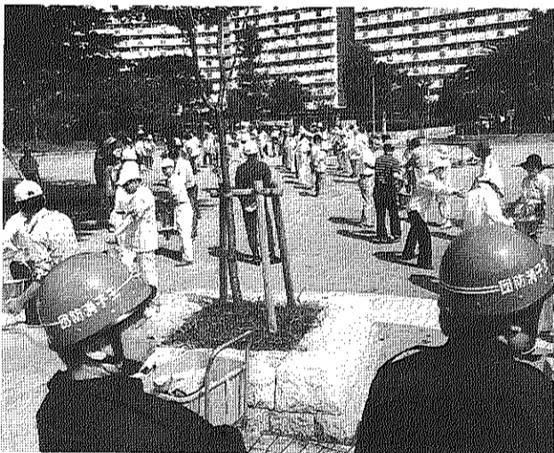
いざとなったら人力だより（9月5日）

鉄部等塗装工事は各室内に入る1日工事となります。工事日程は各戸にお知らせが入ります。