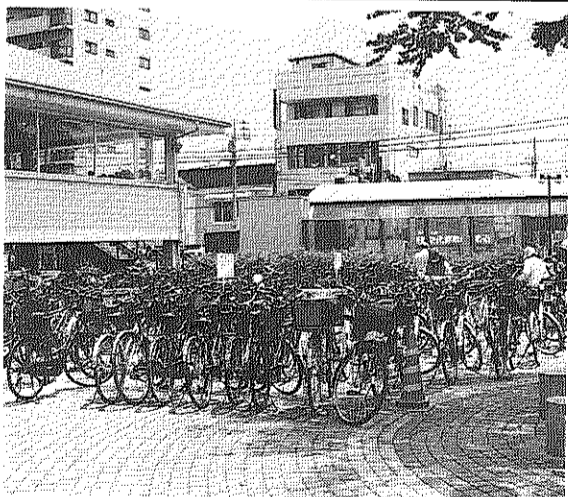
このような状況はごめんです

期間をおき、10月31日から撤去作業に始まり、11月12日撤去を完了しました。自転車1450台、バイク47台です。各フロア・自転車置き場の撤去は、11月9日、自治会役員が自転車に撤去予告札を付け、11月20日その札がはがれているものについて、フロア・自転車置き場から移動・展示をいたしました。