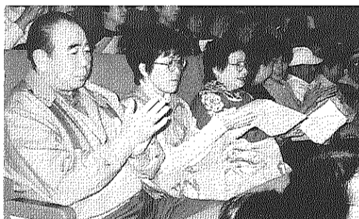
全国集会参加の自治会役員 (昨年12月5日)

毎の家賃繰り返し値上げルールの定着をはかり、周辺民間住宅との家賃逆転現象も生まれていません。自治会はこの様な状況の中で、東京二十三区自治協全国自治協に参加する全国の団地居住者・自治会とともに「住まいは福祉」をメインスローガンに、「家賃の繰り返し値上げ反対」「民営化を許すな」などの要求を掲げて、95全国統一行動をおこないました。十二月五日の「全国公団住宅居住者総決