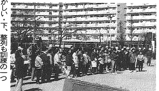
上、消火器使用で初期消火訓練・中、三角巾はむすかしい・下、整列も訓練の一つ