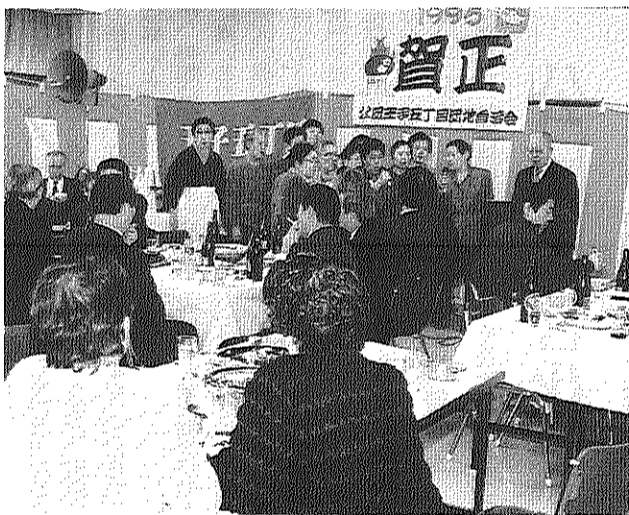
桜美会の美音が響く