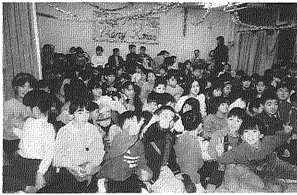
写真上：買い物客でにぎわった中田町物産展(十一月二十七日) 写真下：子どもクリスマス会に集まった子どもたち(十二月十七日)