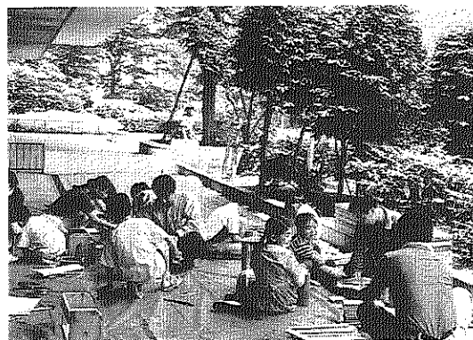
「テンパイ即りだよ」上。木工教室の子どもたち