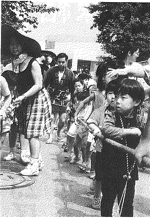
第17回団地まつりの「子どもだし」

第131号・1994年7月14日 公団王子五丁目団地自治会 東京都北区王子5丁目2番 編集責任者・宮野 忠晴 発行責任者・滝沢 勝 自治会連絡所(集会所No. 1) (電話) 3913-6723 〔開設時間〕月～金 10時～16時