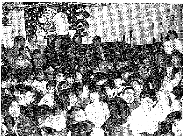
(上) 団地ファミリー運動会 (下) クリスマス会