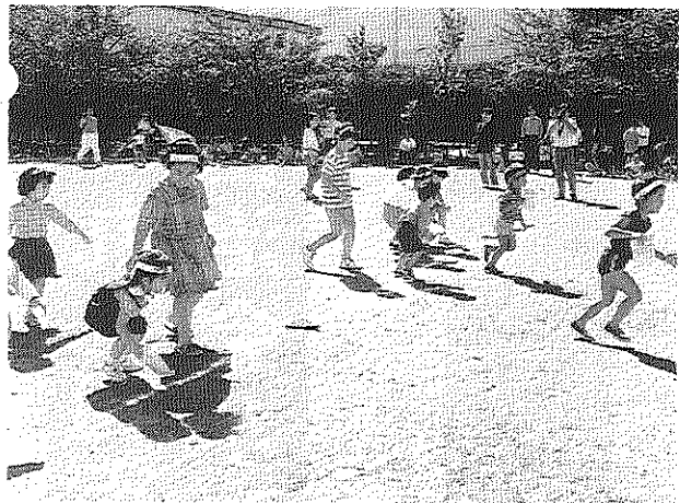
(上) 団地まつり (下) ラジオ体操