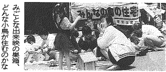
みごとに出来映の集箱、どんな小鳥が住むのかな