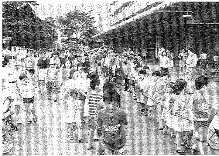
350人の子ともだし・みこしの巡行（第16回団地まつり）

「子どもたちが喜んで」と、自治会役員と多くの居られた団地まつりも、今年十、七回を数えることになり、ついにすたむちの話し合いをた。実行委員会は、参加されるみなさんの楽しみ方の多様化や、様々な状況変化にとまならないプログラムも工夫し、実行委員会は年々お手伝