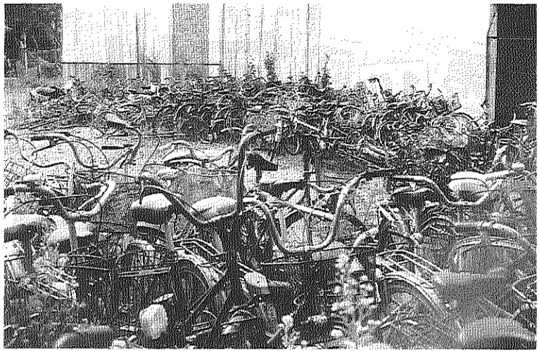
山積みされた放置自転車の山、この後始末は？