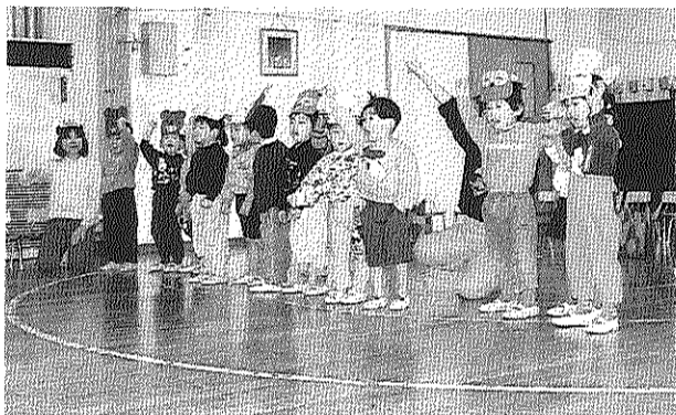
先生といっしょに楽しそうです