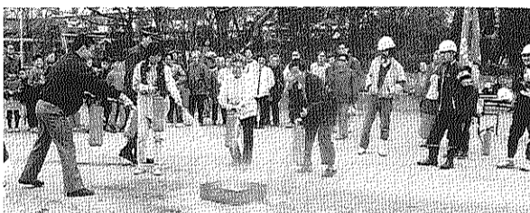
初期消火訓練では、居住者三角パケツと消火器はうまく使えましたか？

の方も実際に消火器、三角パケツを使って消火訓練を体験しました。 天ぷら油火災の実験では、水をかけると、一瞬に広がる炎に参加されたみなさんもびっくり。消防署員の説明に耳を傾けていました。 今回、北区役所区民部防災課の協力により、起震車も登場しました。子どもからお年寄りまで多数の方が、「震