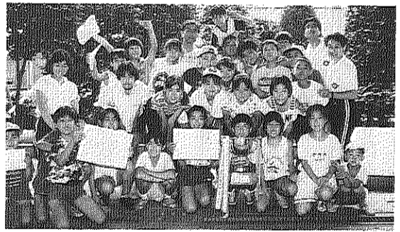
球技大会で優勝 - 7月28日