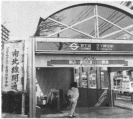
地下鉄「南北線」開通—11月29日

1、公団の「団地再整備事業」、北区の団地内施設設置計画と東十条・王子五丁目地域まちづくりにたいして取り組みます ①公団が進めている「王子五丁目団地再整備事業」と今後の住環境整備計画に、ひきつづき自治会の意見を取り入れさせるようにします。 ②北区の五号棟公共施設予定地活用計画(健康増進センター)に自治会の意見を反映させるようにします。 ③北区が着手した東十条・王子五丁目地域まちづくりプランにたいして、自治会の意見を反映させるようにします。 2、住宅の修繕促進、団地の住環境維持の活動を進めます ①公団負担で修繕する部分を拡大し、ふすま張り替えなどの自己負担修繕を割引価格で実施できるよう、自治会としての「共同発注」活動に取り組みます。 ②団地の共用部分についてお互いに大切に住みあうようよびかけを強め、必要な修繕の