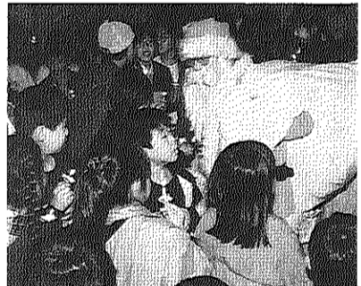
子どもクリスマス会で-12月21日

王子五丁目団地に住み、生活を営むすべての家庭のために、居住者の目に見えるところ、見えないところ、さまざまな課題に対して、自治会は役員会を中心に一年間、精いっぱいがんばってきました。 みんなが安心して住み続けられることができる団地、住民同士の間が気持よくあつちやうな関係を築ける団地、自治会がなかつたら、いったいどんな団地になってしまったらどうかというのを考えると、一九九一年度の取り組みはすべての会員のみなさんに大いに評価していただけるものであったと、確信をもって報告できます。 もちろん、不十分な点、取り組みができていなかったことなどもたくさんあります。会員の意見をきいて出てくる、より良い自治会にしていくにはありません。 来期もまた「団地再整備」、住環境、団地生活のモラル向上などの課題をはじめ自治会が取り組むべき課題が山積みしています。また、自治会発足時から十五年間維持してきた会費(月額三百円)についても、自治会の役割が多方面にわたり、諸経費が大幅に増大した今日、検討しなければならぬようになってきています。 みんなで一九九二年の活動をいっそう充実させていきましょう。