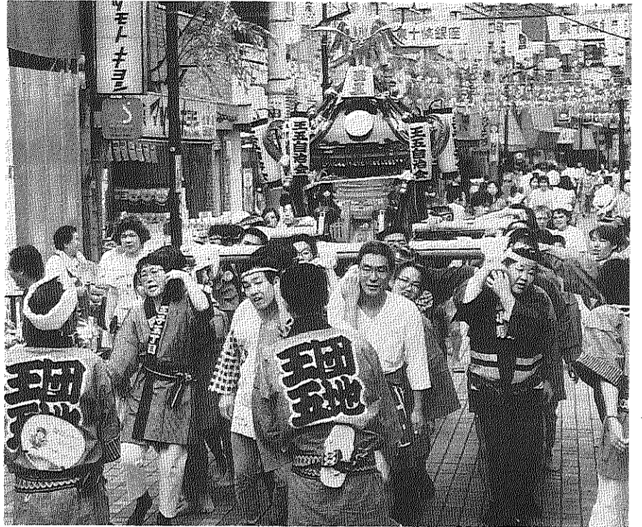
東十条商店街を巡行する王五団地の手づくりみこし- 8月4日