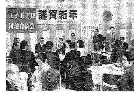
新年会で関係団体の人たちと交流-1月12日

自治会活動の仕上げと来期への橋渡しをする大切な時期に当たり、役員が最も神経をすり減らす総会準備(議案書や予算・決算の作成、代議員・新役員組織など)に連日の会議と実務が行われました。 他団地や関係機関とのいろいろな会合も多数もたれ、それぞれに出席した役員