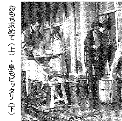
おもちゃ求めて(上)・息もピッタリ(下)