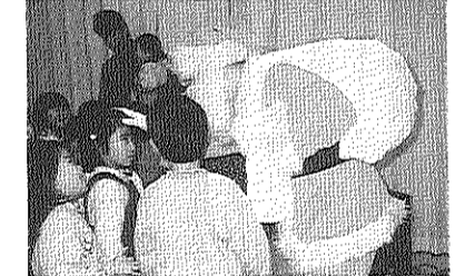
(上) みんないい顔してるね (左) サンタさんは人気者

年の瀬まじかの十二月二十一日(金)、自治会主催(青年児童部担当)による子供たちおまつり(二部)に分けて「子どもクリスマス会」が集会所で行われ、用意され、みんなすてきなクリスマス会となりました。今年も、学校にいったい子供たち(一部)と少年児童部担当)による子供たちおまつり(二部)に分けて「子どもクリスマス会」が集会所で行われ、用意され、みんなすてきなクリスマス会となりました。 「あつた、たべたヨ120キ。晴天に家族づれでにぎわう」 「自治会年忘れもちつき大会」