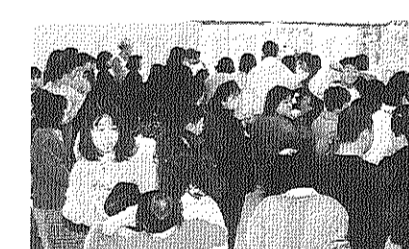
さんからプレゼントをもらいお父さん、お母さんと一緒に