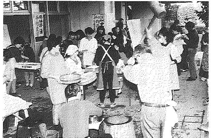
恒例のもちつき大会。大量のもちもあつという間になくなりました

団地居住者が心を開きお互いなかよく暮らしていくことはすてきなことです。自治会の年間行事は四季おりおりの催しを企画しみなさんに喜ばれていますが、なかでも団地 すめられました。王五団地も十四年を経過した今、住まいの環境改善は切実な問題となっています。今後とも細かい対応をしていかなければなりません。 自治会は今期も団地サービス・清掃班の協力を得て、放置自転車の撤去作業を行いました。また、東京支社交渉により放置オートバイの撤去も実現させました（二三〇台）。しかし、人員や資金面（自治会出費なし）での不足もあり、一向に減少しない現実をみると二人ひとりが適切