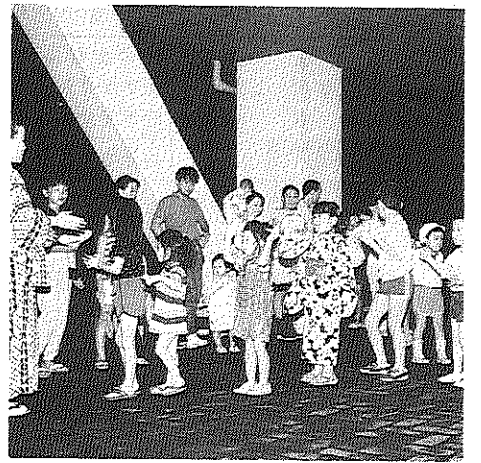
台風のため会場を6号棟ピロティ一にうつしました

自治会の活動は団地生活を営むみなさんの目につかれようとする必要がないまでも多岐にわたっています。生活に直結する家賃運動や、修繕など住環境向上の取り組み、そしておのりのある交流をもつて楽しく暮らすこと、役割として役立つ「ハウ」の提供、などみなさんの生活の