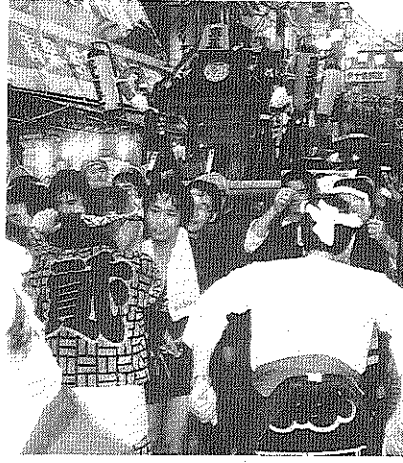
今年も東十条商店街にくり出したおみこし