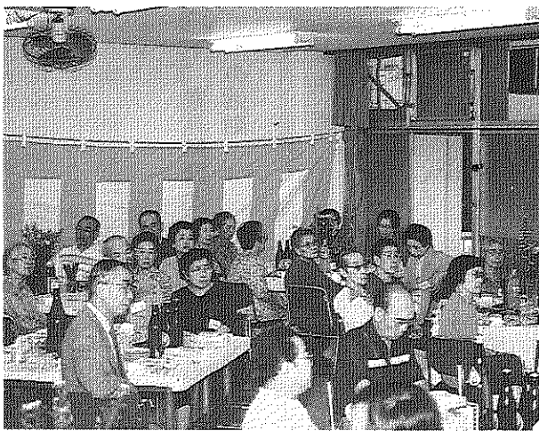
楽しくすごした敬老会

地下鉄七号線の部分開通（岩淵・駒込間）を一九九一年に控え、自治会は公団が地下鉄駅開設にともなう形で進めている公団の団地内北通り沿い再開発に対し、居住者の要望が十分に生かされるように団地商店会なども協力しあって取組を続けています。住棟の新設、スーパーマーケット・レストランの建替え、戸割り店舗の新設、周辺整備など、公団に対し細部に渡り数回の交渉を行いました。ま