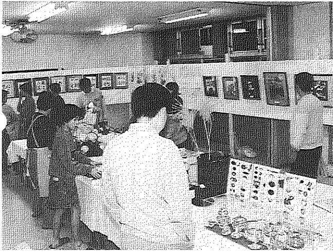
念願の文化祭、多くの作品の出品がありました