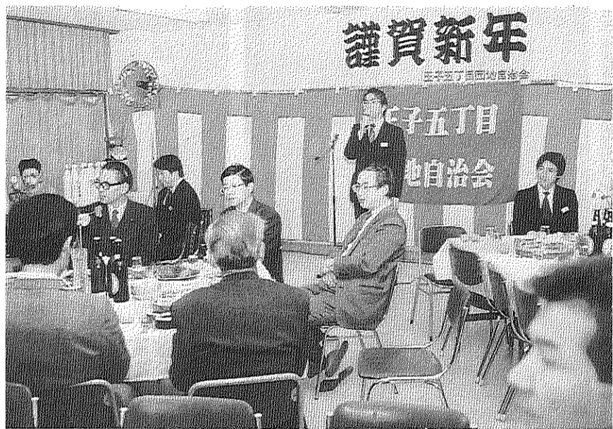
なごやかに交流しあった恒例の新年会であいさつする自治会会長