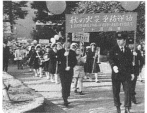
王子消防署と順天学園のパレード