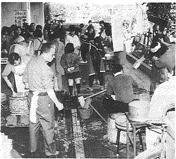
百三十キロのもちをつくのはほんじに大変なんですヨ