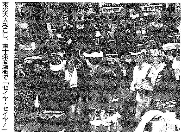
雨の大人みこし、東十条商店街で「セイヤ・セイヤ」