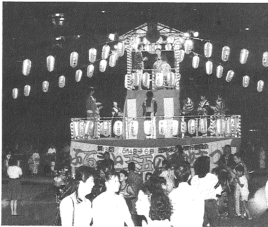
中央広場でのぼんおどり、ちょうちんの灯りの中で心も体もおどります

第十三回五丁目まつりは八月四、五、六日の三日間にわたりおこなわれました。 初日、二日目と天候に恵まれたものの、最終日は台風直撃となるなど、いろいろ大変でしたが、最後まで事故もなくプログラムに沿ってすすめることができました。実行どこかにあなたが写っていると思います。 委員のみなさん、ほんとにご苦労さんでした。そしておまつりに参加してくれたみなさん、協力ありがとうございました。今回の会報では、紙面のゆるやかな写真の写真をのせました。ご家族と一緒に楽しんでください。きつと