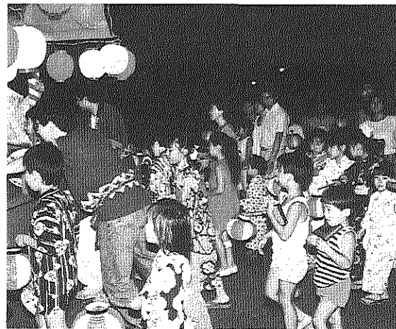
みんなで楽しくちょうちん行列