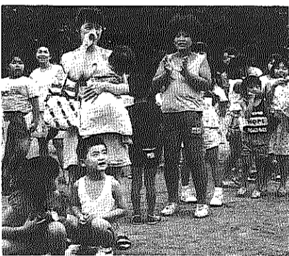
左上、子どもたちがいっぱいゲーム大会右上、台風の中、ピロティに場所を移してどじょうつかみ、左下すいかわりは楽しいネ、右下、工作教室でゴム鉄砲作り