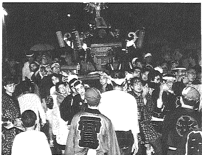
2時間の巡行を終えて団地へ、実行委員も飛び入り