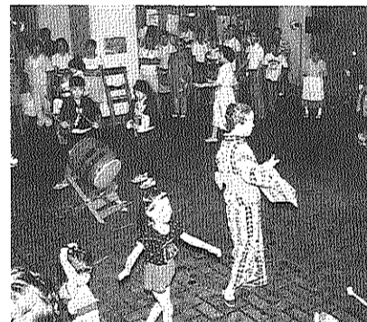
雨でもピロティでおどれます。

おまつり思い出集 ●みなさんからの寄付合計が昨年の記録を更新、史上最高に。ほんとうにありがとうございます。実行委員会の責任も、ますます重くなっていきます。来年は一人でも多くの参