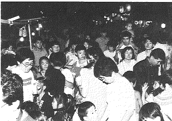
ほんとにすごかった人の波、土曜の夜はどこもかしこも大フィーバー