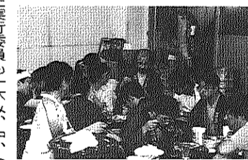
左実行委員も一休み、中、たるぎげをどうぞ、右もき店はおお忙がし