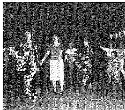
ゆかたのギャルも、お母さんも

●二日目(土曜日)の夜の出入はたいへんなもの。来客のみなさんもあまりの多さにただただビックリ。もぎ店もさきう忙がしかったのでし