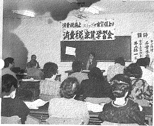
「家賃転嫁」とんでもない (3月12日学習会)

今期に入り、団地をとりまく状況に大きな変化が生まれました。第一に、周辺民間住宅家賃の異常なまでの高騰と、新設高家賃団地の相次ぐ出現です。この現象は数年前から自立ちはじめてはいましたが、全国有数の高家賃団地として知られていた王子五丁目団地が、高い家賃負担の実態に変わりはないのに、もはや突出した高家賃団地と言いきれない風潮を作り出してしまいました。第二に、八月に発覚したリクルート騒動事件と、それに続く十一月強行採決で成立した消費税の問題です。特に、消費税に対しては自治会がいち早く、その不当性の強いものとしての本質を指摘し、消費税が表面化した七月には緊急役員会の決定で消費税反対の署名運動を展開していったのに、成立後の家賃転嫁を