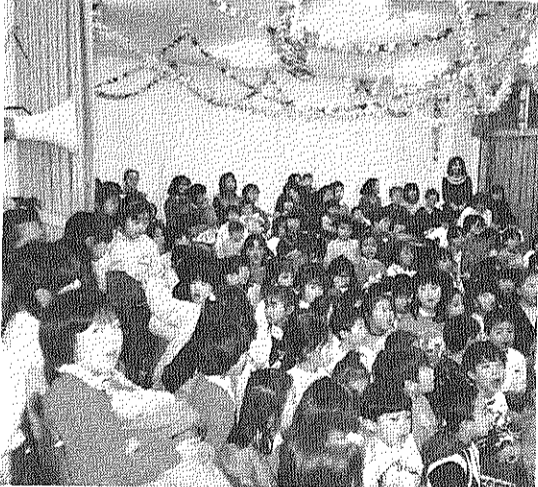
楽しいクリスマス、今日のプレゼントは何かな?

ただ、自治会の再三の呼びかけにもかかわらず、引き取りが遅れ、九件の盗難事件が発生したことは大変残念でした。同時に、消防署から、現行の供給方法について、安全な運用を心がけるように大量の灯油を長時間放置しないことなど一との指摘もあり、利用者のみなさんのよりいっそうの協力が望まれます。