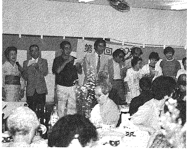
お年寄りに楽しみを (敬老会にて、9月15日)