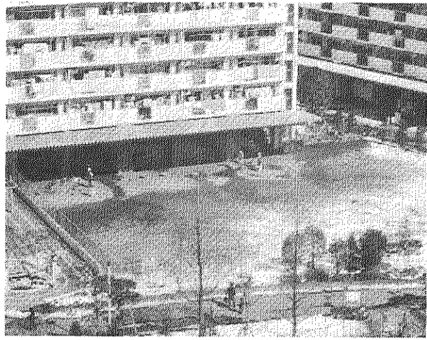
区立の遊び場になる3号棟空地

自治会が長い間、北区や住・都公団に対し要望し、たび重なる陳情と交渉などで運動し続けて来た三号棟前の公共施設予定地に区立の遊び場設置工事が始まりました。期間は四十五日間で四月中旬に完了の予定です。同時に北本通り添いバス停前の公衆トイレ設置工事も始まりました。六年間にわたる住民の要求と自治会活動の記念すべき成果と言えます。