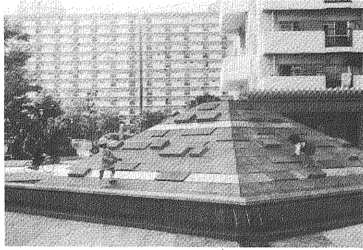
不慮の事故をお互いのトラブルに発展させないために……

高層集合住宅では水もれ事故の発生は避けられないのが現状です。団地の建築構造に根本的問題があるといってみても、当座の解決策にはなりません。自治会が「自治会共済」に加入し、このお見舞い金制度を実施に踏みかけたことは画期的で、自治会として大歓迎です。未入会の世帯の自治会入会を心から呼びかけるものです。