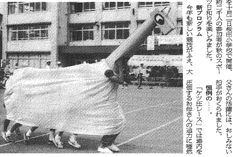
第三回団地ファミリー運動会に二千人参加