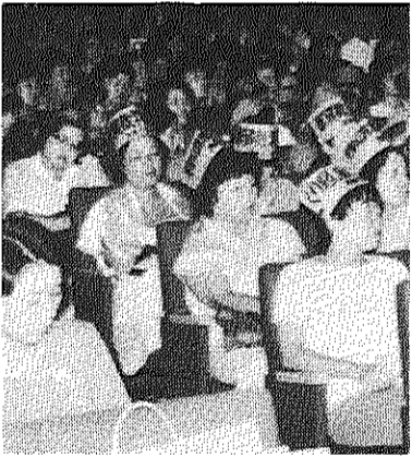
高家賃と家賃値上げ反対—全国団地居住者決起大会(9月13日)

自治会は十一月十三日から王子五丁目団地の「高家賃引き下げ」を建設大臣と住・都整備公団総裁に要請する署名活動を開始します。