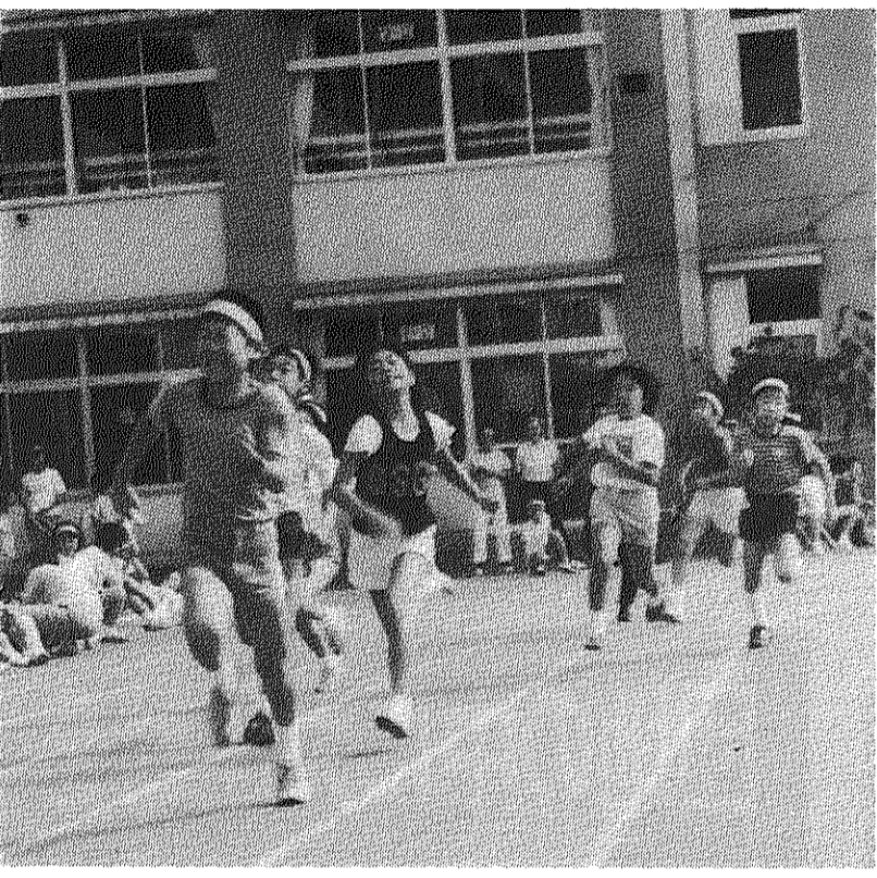
第三回団地ファミリー運動会に二千人参加