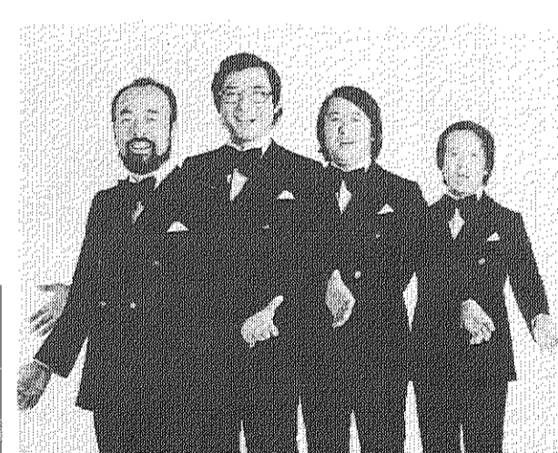
ボニージャックス

第五回団地まつりのハイライト。入居五周年記念の呼びものボニージャックスのステージは八月一日、土曜の夜七時から八時の一時間、中央広場に特設屋外ステージを作っておこなわれます。子供から大人まで楽しめる幅広いレパートリーを持ったボニージャックスの歌をあなたの目と耳で、十分に堪能して下さい。