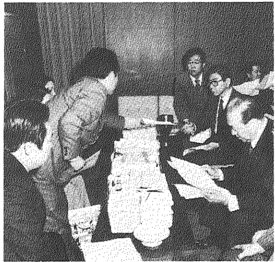
「高家賃引き下げ、住みよい団地づくり」を求める王子五丁目団地など全国団地住民約六万人分の要請署名を青森建設大臣(右はし)に提出する全国公団自治協の役員(2月27日)

昨年の十一月以降、自治会でおこなった「高家賃引き下げ、傾斜家賃の即時打ち切りを求める国会請願署名」は、四月一日に自治会役員など七名の団地居住者が国会へいって、国会議員の方々に提出しました。また、この日は「住宅・都市整備公団」の法案審議もあり、傍聴してまいりました。