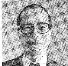
王子五丁目団地の皆さん、自動車文庫の停車場(ステーション)が設置できることになり、おめでとうございます。ふりかえってみますと、王子五丁目団地の皆さんから、この要望を出されたのは、昭和五十二年でした。図書館としても、種々検討しましたが、当時、三十ヶ所あるもののステーションをかかえ、フル回転でまわす余力がなかったこともあり、区立中央図書館に近づくこともあつたのであります。これから団地の皆さんと話し合いながら、出来れば五月中旬頃から伺うようにしたいと思っております。どうか可成りご利用頂きたいと思っております。

安くて助かりました 灯油共同購入ぜひ続けて... この冬はものすごく寒い、と、うしろから暖房機を安く買ってきた、おどろおどろしい。3、4号棟は暖房機で温かいので、移動できないかな、と思ったこともありました。でも自治会の共同購入で1270円という格安な値段で灯油が買えて助かりました。 (6号棟・主婦可)