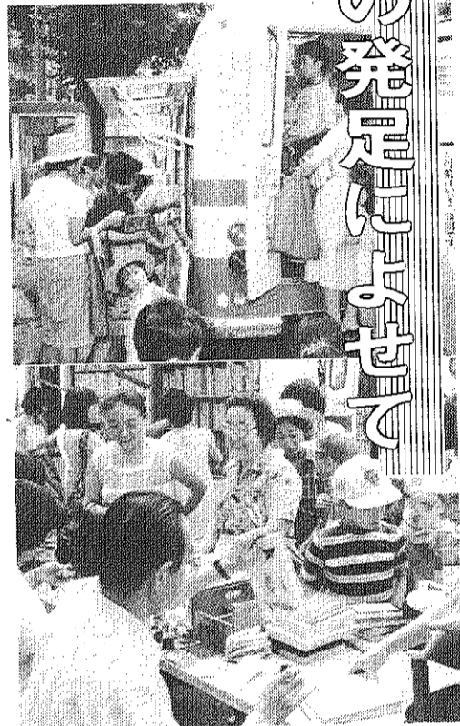
午前10時、A班B班の出発準備はほぼ終る。薄暗い車内、きちんと整理された折り付けの書架と書架の間には、折りたたみのテーブル・椅子・書架が積み重ねられ、乗降口に近づくには貸出・返却業務に使う小道具や、予約本、書架に収容しきれない図書や紙芝居の入ったボックスが置かれてる。 座席は運転席のほか3席が用

王子五丁目団地の皆さん、 自動車文庫の停車場(ステーション)が設置できることになり、おめでとうございます。 ふりかえってみますと、王子五丁目団地の皆さんから、この要望を出されたのは、昭和五十二年でした。図書館としても、種々検討しましたが、当時、三十ヶ所あるもののステーションをかかえ、フル回転でまわす余力がなかったこともあり、区立中央図書館に近づくこともあつたのであります。これから団地の皆さんと話し合いながら、出来れば五月中旬頃から伺うようにしたいと思っております。どうか可成りご利用頂きたいと思っております。