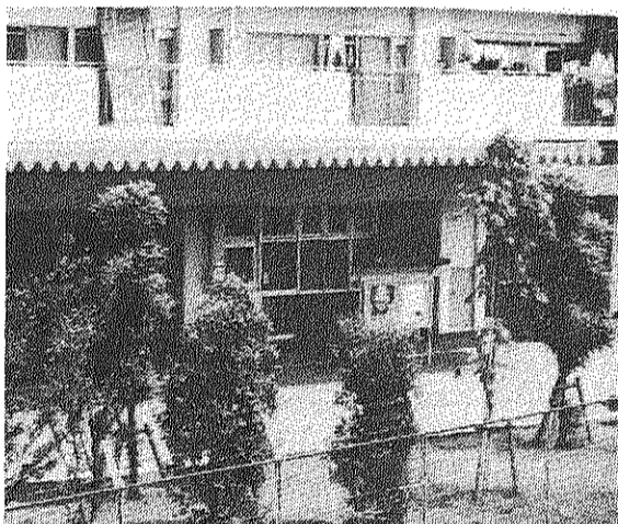
共益費の話し合いで団地の線を守り、ふやすことも話題に...

自治会の質問（五本柱・十項目）に対する公団の回答と自治会の意見の主なものは次のとおりです。 ●電気料金について 「質問」共用灯の電気料金に約するところが大切。夕方明るい時間から蛍光灯をつけ、朝明るくなるまで消さないというごとのないようにはしてほしい。具体的な場所を指定したり、時間を指定したりして対処したい。 ●給水施設管理費について 「質問」内容がよくわからないので具体的な説明を。 「公団回答」団地の給水施設に関する維持管理費である（受水槽一カ所、高圧水槽九カ所など）。具体的には、水費の維持管理に伴い、常駐者一名（残留等）の測定および水道日報の