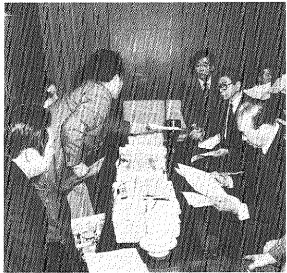
「高家賃引き下げ、住みよい団地づくり」を求める王子五丁目団地など全国団地住民約六万人分の要請署名を斉藤建設大臣(右はし)に提出する全国公団自治協の役員(2月27日)

昨年の十一月以降、自治会でおこなった「高家賃引き下げ、傾斜家賃の即時打ち切りを求める国会請願署名」は、四月一日に自治会役員など七名の団地居住者が国会へいって、国会議員の方々に提出しました。また、この日は「住宅・都市整備公団」の法案審議もあり、傍聴してまいりました。