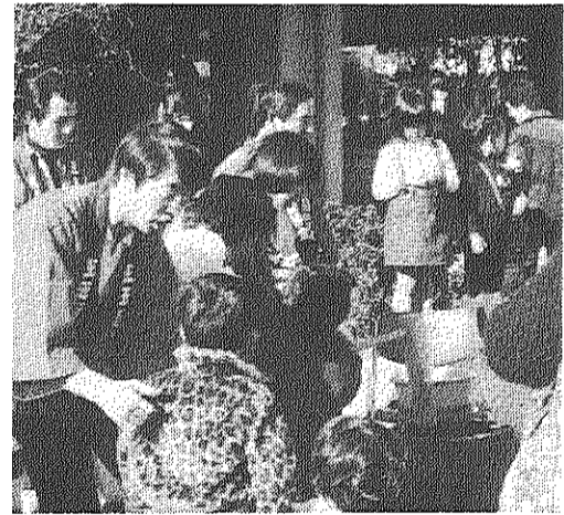
もちつきは子どもたちの人気のマツ (昨年のバザーで)

自治会は年末の楽しい行事を企画し、みなさんの参加を呼びかけています。 子供クリスマス会 恒例年末バザーは二十一日午前十一時から集会所で開きます。 バザー・もちつき大会 自治会では、バザー実行委員会を主催し、二十日夜七時から集会所で開きます。 子供クリスマス会 恒例年末バザーは二十一日午前十一時から集会所で開きます。