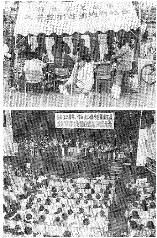
(上) 団地入口で署名集めにがんばる (下) 全国公団居住者の総決起大会

自治会は全国の公団住宅自治会と足並みをそろえ、「住みよい住宅、住みよい団地を要求する第十二回全国統一行動」に参加し、王子五丁目団地の高家賃引下げ、傾斜家賃ストップ実現のため、十一月十六日以来、署名・カンパ運動にとりくみ、居住者のみなさんの大きな協力を得ています。 九月、千代田区・九段会館での「住みよい住宅、住みよい団地を要求する全国公団住宅居住者総決起大会」(全国公団住宅自治会協議会主催)に、前日