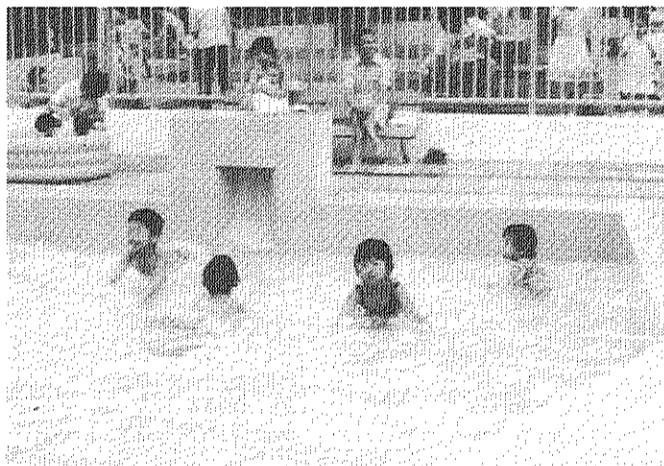
チビ子は水の中で大はしゃぎ

一九七七年十一月二十七日に結成された王子五丁目自治会は、翌年二月四日に「住まよ」団地への「めざし住宅公団北営業所」第一回目の交渉をおこないました。この交渉には、自治会として二十七日の要請を提出しましたが、このなかの一項目「じゃぶじゃぶ池」の設置については「この項目をあげ、その実現を強く要望しました。この時は残念ながら設置はされませんでした。しかし、この時は残念ながら設置はされませんでした。しかし、この時は残念ながら設置はされませんでした。