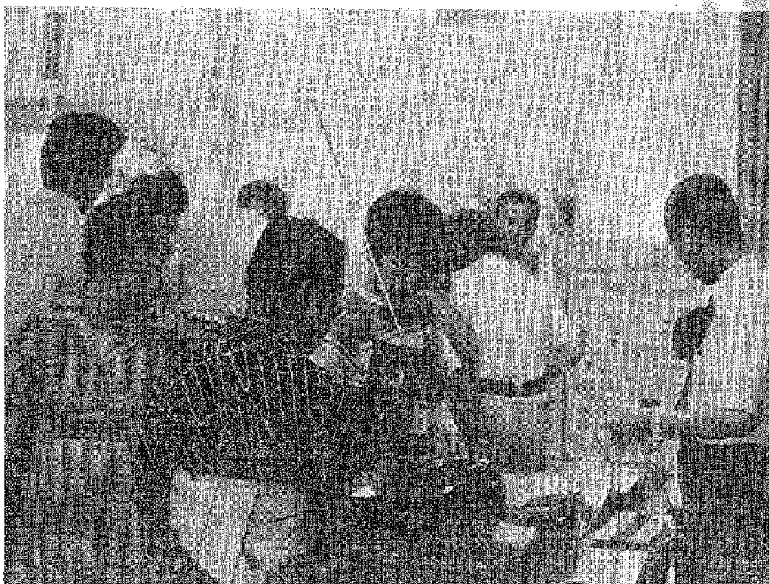
八百人の住民が参加して 大成功した準備会主催のバザール（七月十七日）