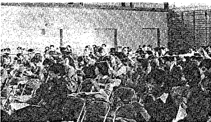
住みよい団地づくりへ期待こめて一結成総会